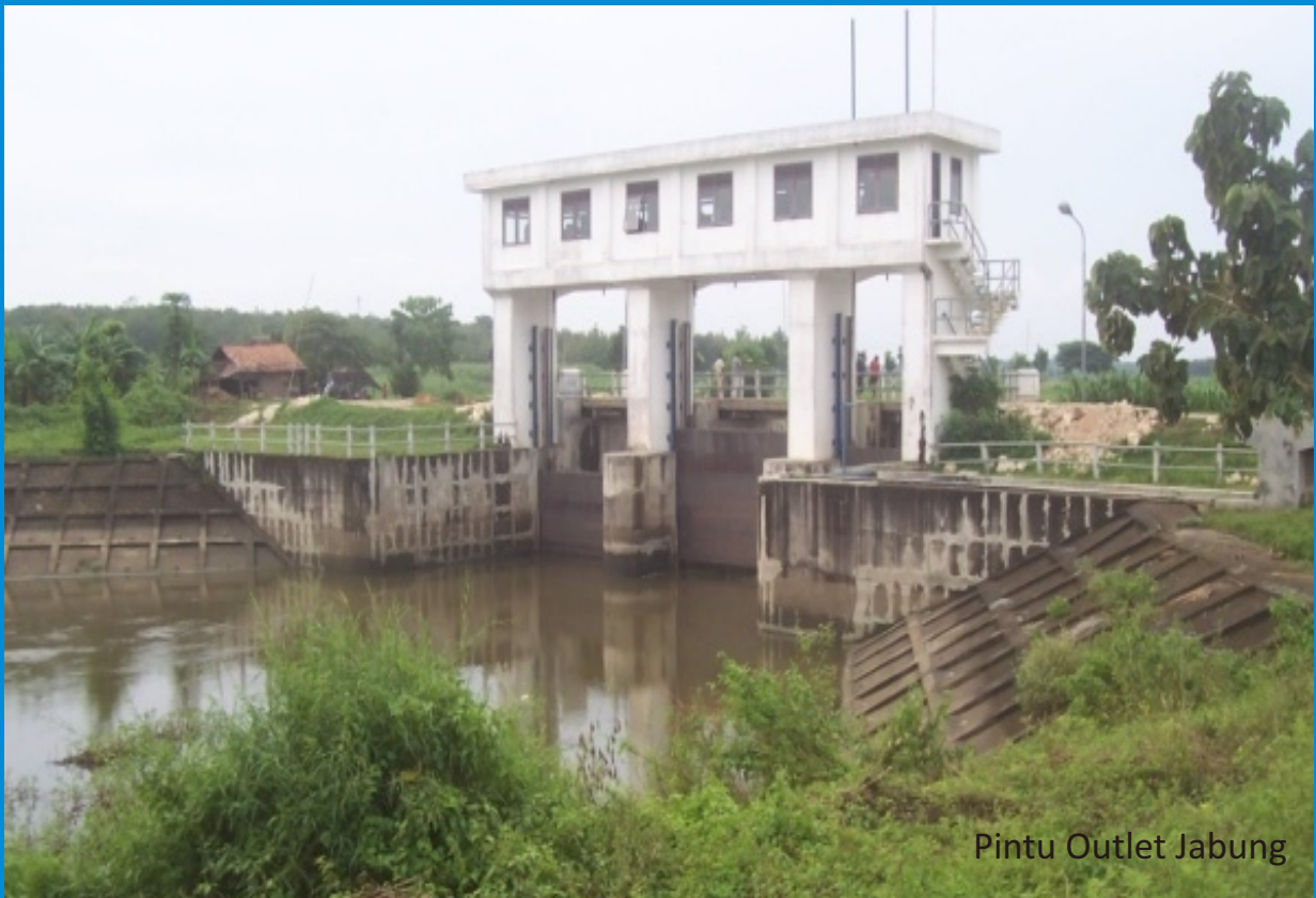
Pintu Outlet Jabung